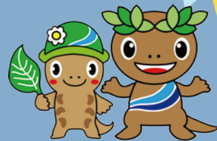
森っこサンちゃん